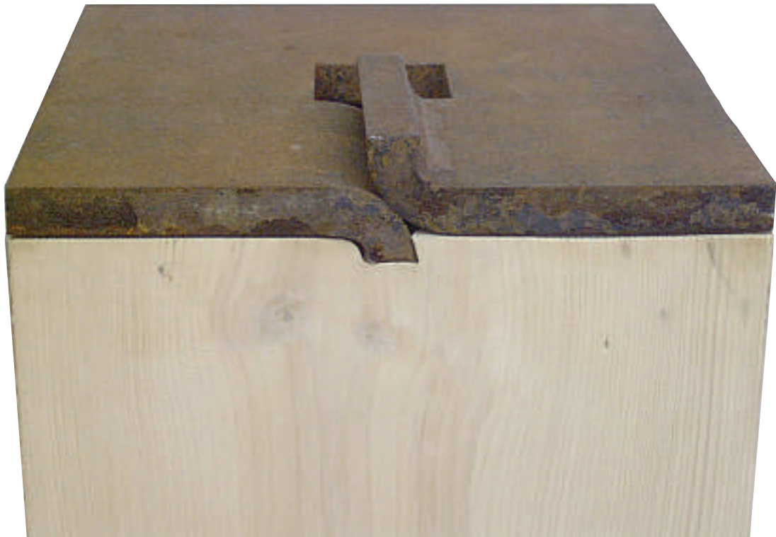
2002 Stahl geschmiedet 6 x 30 x 30 cm