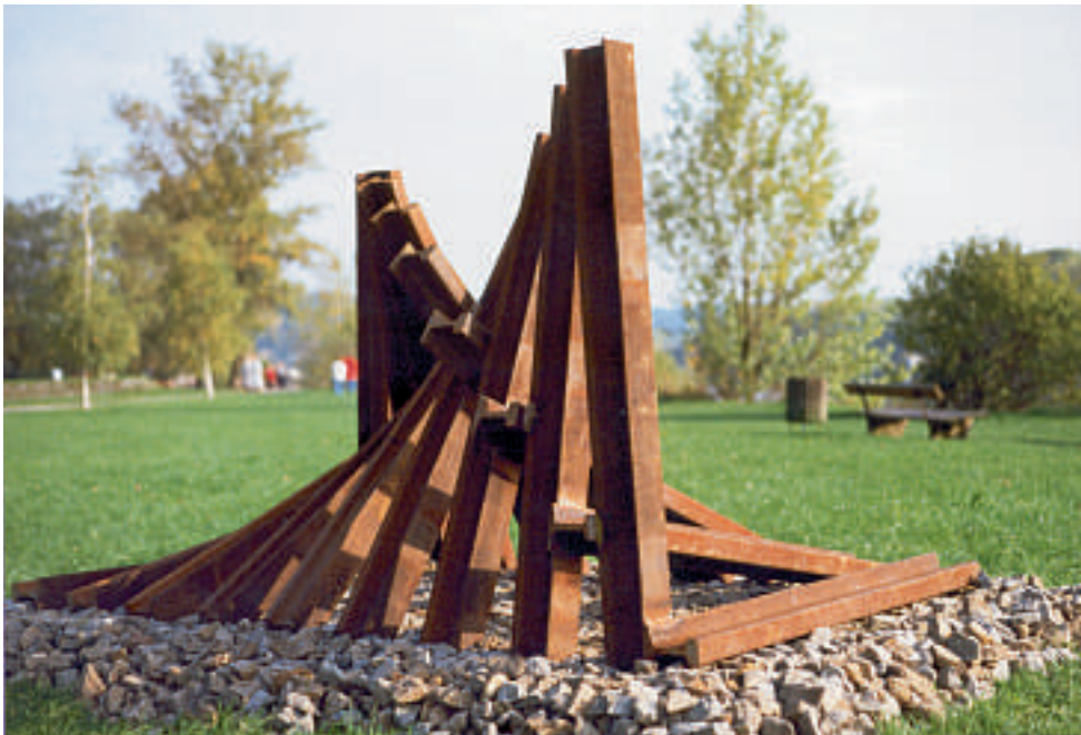
„hinauf – verschwunden, hinunter und weg“ 1993 Stahl, Gleisschotter 135 x 135 x 243 cm