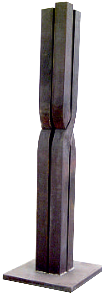
„Stele“ 2003 Stahl geschmiedet 155 x 15 x 15 cm