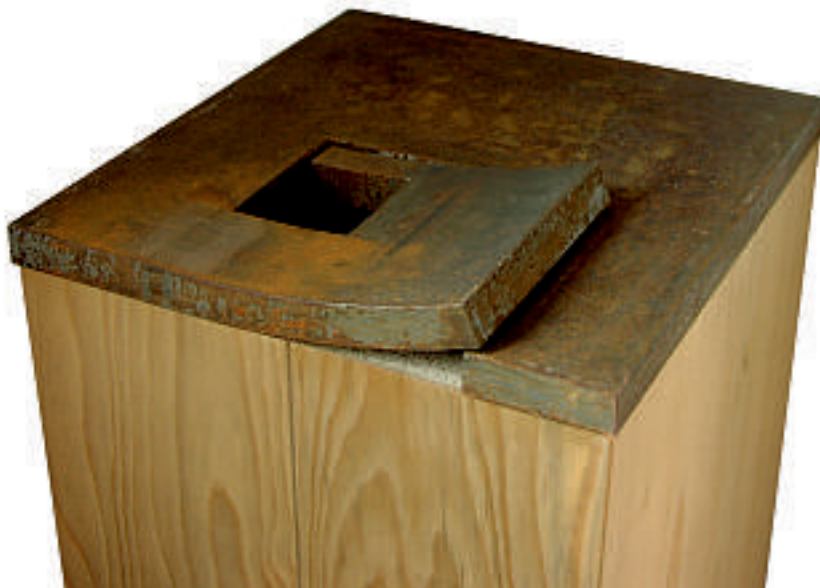
„gefangen“ 2001 Stahl geschmiedet 5 x 29 x 31 cm