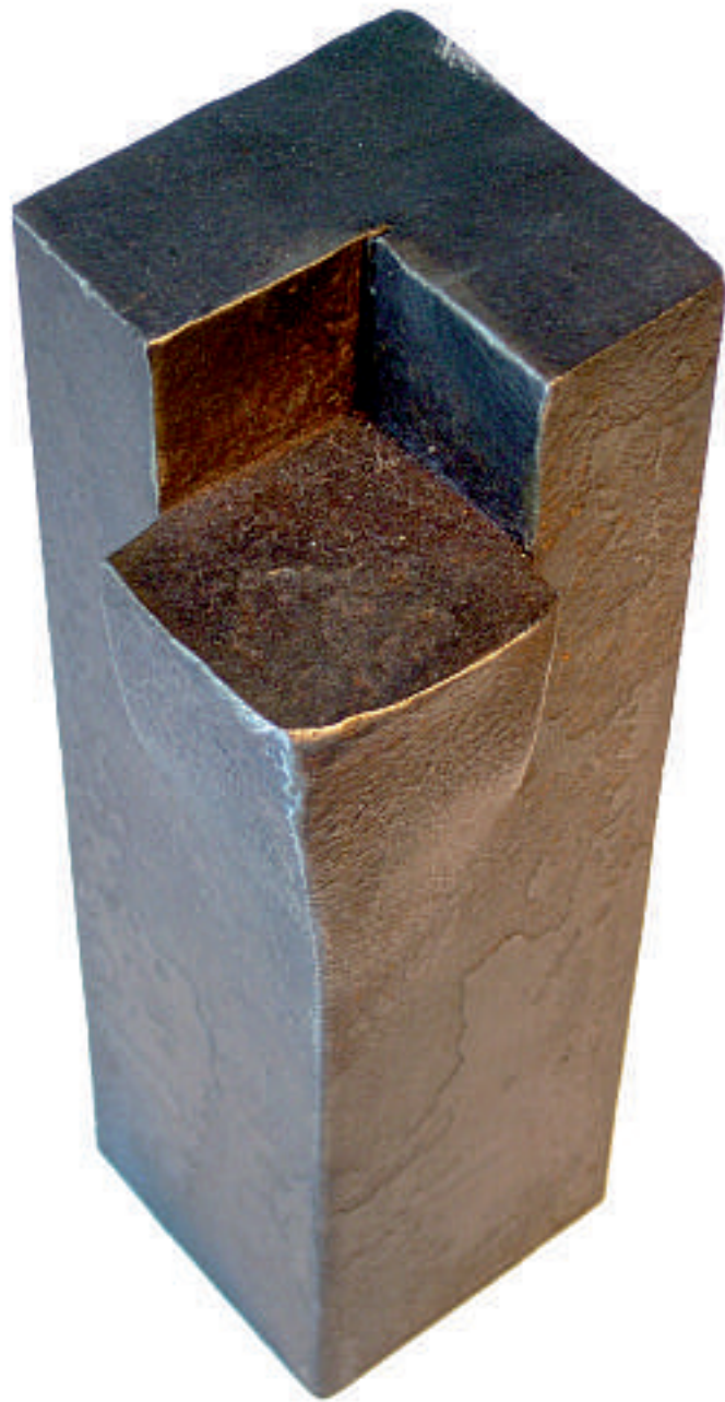
2002 Stahl geschmiedet 24,5 x 8 x 8 cm