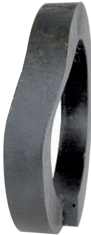
2001 Stahl geschmiedet 30 x 30 x 6,5 cm