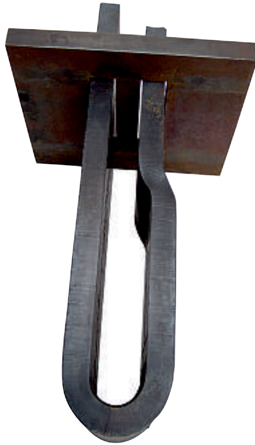
„wie es euch gefällt / Realität“ 2003 Stahl geschmiedet 19,5 x 21 x 38 cm