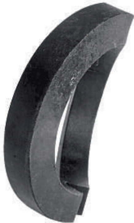
2002 Stahl geschmiedet 30 x 30 x 10 cm